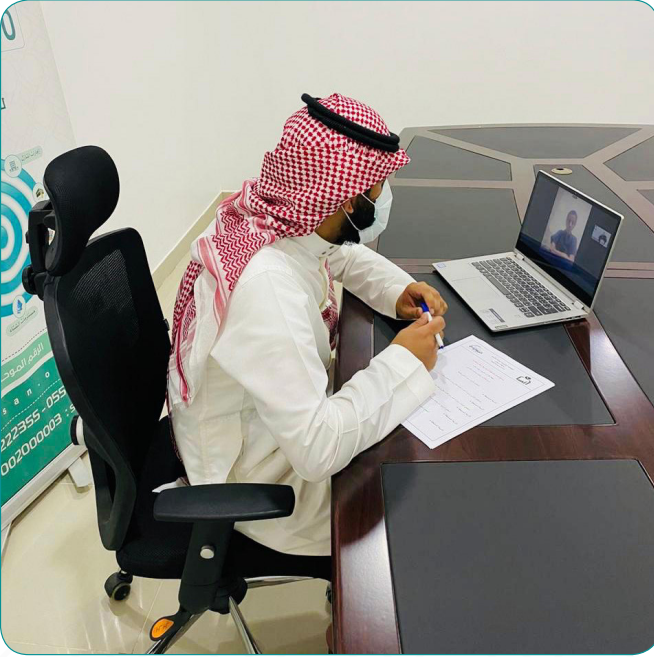
جانب من تصفيات مسابقة مهارة الإلقاء.