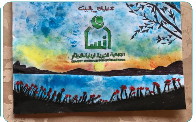
جانب من تصفيات مسابقة الرسم.