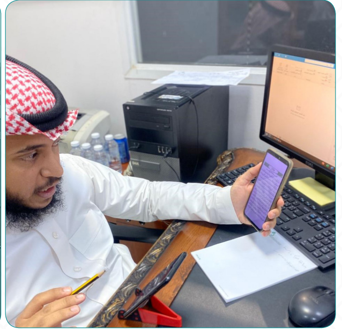
جانب من تصفيات مسابقة القرآن الكريم.